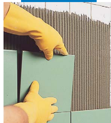
Полагане върху стари плочки