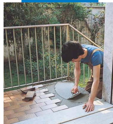
Хидроизолация, изравняване и полагане на настилка с Kerabond T+Isolastic