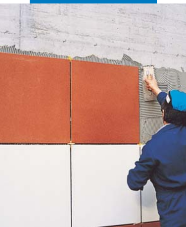
Полагане на големи по размер плочки с Kerabond T+Isolastic