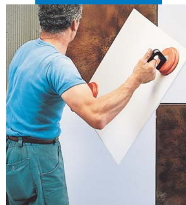
Полагане на KERAION върху стена