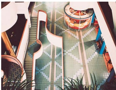
“Порцеланови” теракотени плочки, положени с Kerabond+Isolastic, Civic Center, Северен Йорк Онтарио (Канада)